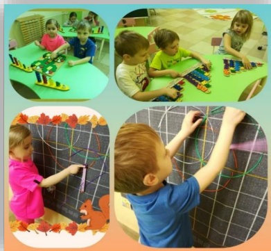
«Сказочные лабиринты игры» В. В. Воскобовича